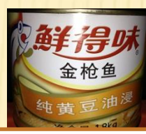
鲜得味 金枪鱼 纯黄豆油浸 1.88kg/罐×6罐