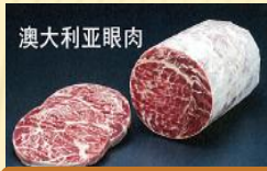
澳大利亚眼肉 2塊/箱或180g*28袋