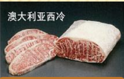
澳大利亚西冷 2块（約5kg）/箱