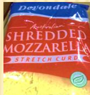
德运马苏里拉芝士碎 2KG/袋*3袋/箱