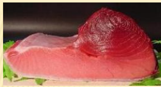
印度刺身(冷冻)块、片 块: 5~82kg 片: 2.5kg前後