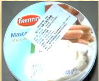
马斯卡布里（特兰汀） 500g /罐×6罐