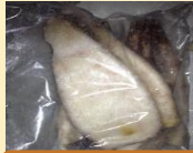
真鱿带皮耳筒 (150G-210G) *5*12