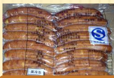
福吉源（冷冻） 300g(16根)/袋×20袋