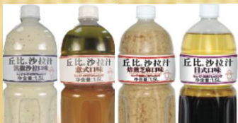
凯撒沙拉汁等（各种沙拉） 1.5L/6瓶