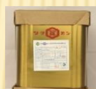
各種业务用酱油 18L/桶