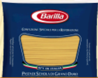
百味来意大利面（意式通心粉） 5kg/袋×3袋/箱