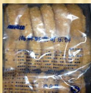
海鲜野菜可乐饼 (80g×20)/袋×5袋