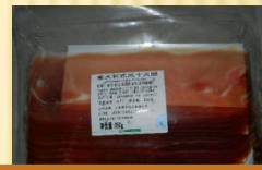
意大利式风干火腿切片 500g