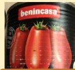
比妮卡萨去皮番茄 2.55kg/罐×6罐