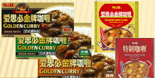
各种各类咖喱具备